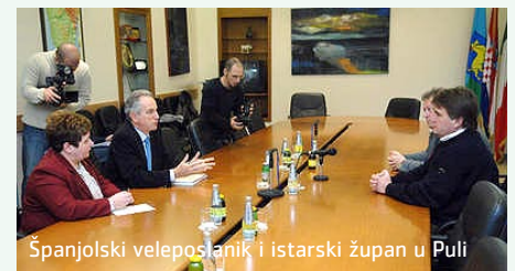
Španjolski veleposlanik i istarski župan u Puli

Razgovaralo se i o pregovorima Hrvatske o ulasku u Europsku uniju čija je Španjolska članica od 1986. To bi donijelo dvjema zemljama još značajnije ekonomske odnose. Veleposlanik Palma prilikom boravka u Puli istaknuo je kako Španjolska Hrvatsku podržava na putu prema EU. Nije zaboravio istaknuti i kako je Istra po primjerice ribolovu, turizmu i klimi slična španjolskim pokrajinama te kako jedna od druge mogu mnogo učiti. Župan i veleposlanik razmjenili su i prigodne darove: maslinova ulja i Picassovu biografiju.