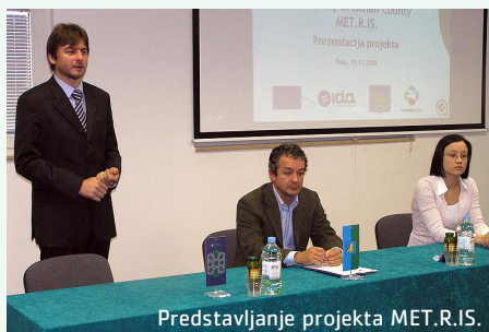
Predstavljanje projekta MET.R.IS.

razina provedenih razvojno-istraživačkih projekata i time djelovalo na podizanje konkurentnosti istarske i hrvatske metalne industrije na globalnom tržištu. Specifični cilj projekta je pružanje usluga istraživanja i razvoja malim i srednjim poduzećima u metalnoj industriji u Istarskoj županiji.