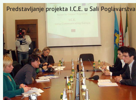
Predstavljanje projekta I.C.E. u Sali Poglavarstva

Projektom I.C.E želi se proširiti znanje i razumijevanje o Europskoj uniji te o procesu europskih integracija među građanima Hrvatske s naglaskom na mlade, promicati prioritetne europske teme (EU građanstvo, međukulturni dijalog i volonterstvo), poticati interes i potrebu za informiranjem o EU, upoznati ciljane skupine s raspoloživim pretpriputnim sredstvima, analizirati mišljenje građana Istarske županije o EU pitanjima (u svrhu budućih regionalnih politika).