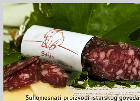
Suhomesnati proizvodi istarskog goveda