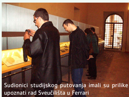
Sudionici studijskog putovanja imali su prilike upoznati rad Sveučilišta u Ferrari

Predstavnici Istarske županije, IDA-e, Grada Pule i Sveučilišta Jurja Dobrile sudjelovali su na četverodnevnom studijskom putovanju u Italiju. Od 10. do 14. listopada imali su prilike posjetiti Ferraru, Bolognu i Ravenu.