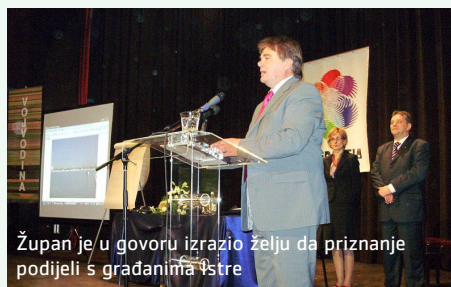
Župan je u govoru izrazio želju da priznanje podijeli s građanima Istre

Vojvođanska Skupština godišnje priznanje za toleranciju dodjeljuje pojedincima i ustanovama za doprinos i promociju ideala tolerancije, solidarnosti i poštovanja ljudskog dostojanstva, a što je posebno važno za Autonomnu Pokrajinu Vojvodinu i Republiku Srbiju jer izražava njihovu opredijeljenost za politiku mira, njegovanja, očuvanja i razvoja različitosti te multikulturalnosti.