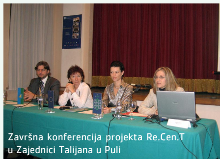
Završna konferencija projekta Re.Cen.T u Zajednici Talijana u Puli

U sklopu projekta educiralo se 15 trenera s područja Županije, nezaposleni su osposobljavani za zapošljavanje, a 20 je žena dobilo vrijednu ECDL (European Computer Driving Licence) edukaciju tj. certifikat kojim se garantiraju određena informatička znanja. Projekt je povećao razinu znanja i vještina nezaposlenih u Istri. Više od 600 pripadnika nezaposlenih ciljnih skupina sudjelovalo je na edukacijama na temu "Uvod u poduzetništvo", od čega je dvadesetak polaznika izrazilo želju i pokazalo interes za pokretanje vlastitog posla.