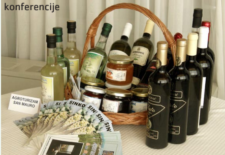
Prezentacija tipičnih proizvoda u sklopu konferencije

Načelo godinama razvijano u Europskoj uniji želi se primijeniti i kod nas, odnosno cilj je da nadležne vlasti za agroturizam budu one poljoprivredne: od Ministarstva pa do lokalne samouprave te da se pod pojmom agroturizam podrazumijeva poslovni subjekt kojemu je primarna djelatnost poljoprivredna proizvodnja, dok je plasman vlastitih proizvoda i druge turističke usluge (noćenja i sl.) tek dodatni prihod.