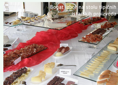
Bogat izbor namirnica tipičnih istarskih proizvoda

Proizvođačima i prerađivačima bilo je omogućeno da svoje proizvode prezentiraju u svrhu promocije tipičnih istarskih proizvoda kao veoma bitnih čimbenika turističke ponude Istre.