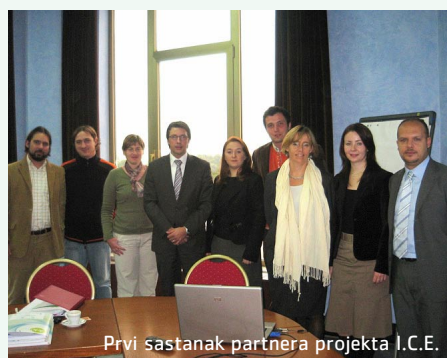
Prvi sastanak partnera projekta I.C.E.

Prošlog tjedna je u Poglavarstvu Istarske županije predstavljen projekt I.C.E - Istria Communicating Europe koji se implementira u sklopu programa "Europa za građane", te je 21. studenog održan i prvi sastanak partnera na kojem je definiran detaljan plan provedbe projekta.