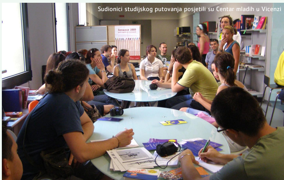
Sudionici studijskog putovanja posjetili su Centar mladih u Vicenzi