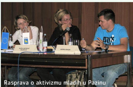
Rasprava o aktivizmu mladih u Pazinu