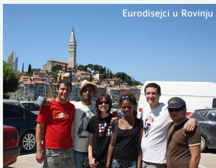
Eurodisejci u Rovinju

Istrani su desetak dana ranije primljeni u palači Varaždinske županije, gdje im je održana prezentacija o Varaždinskoj županiji i provedbi Eurodyssée programa u toj regiji. Nakon povratka iz Starog grada upoznali su kandidate iz Varaždinske županije koji su sudjelovali u Eurodyssée programu. Mladi iz obje županije izrazili su zadovoljstvo ovakvim vidom razmjene dodavši kako je ipak najbolje kad te na izlet vode domaćini koji znaju prezentirati najljepša mjesta svoje regije.