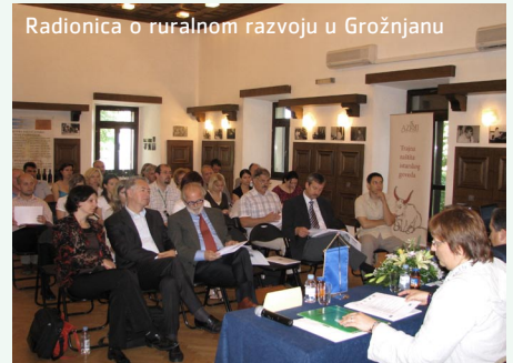
Radionica o ruralnom razvoju u Grožnjanu

tegrirani pristup održivom ruralnom razvoju te je ponudio nove ideje iskorištavanja resursa, poput primjerice šume. Profesorica Elena Pisani s istog sveučilišta prikazala je povijesni razvoj ruralnih područja.