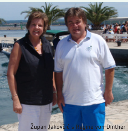
Župan Jakovčić s Regine von Dinther

Istarski se župan Ivan Jakovčić u toku srpnja na Brijunima susreo sa Reginom von Dinther, predsjednicom Parlamenta njemačke Savezne zemlje Sjeverne Rajne Vestfalije (Nordrhein-Westfalen), koja je provela godišnji odmor u Istri. Budući je Sjeverna Rajna Vestfalija najmnogoljudnija, najrazvijenija i najdinamičnija njemačka savezna zemlja, koja osobitu pozornost posvećuje regionalnom razvoju Europe, von Dinther se pohvalno izrazila o rezultatima koje je Istarska županija postigla u europskom međuregionalnom povezivanju, te dala potporu Hrvatskoj u njezinim naporima za priključenje Europskoj uniji.