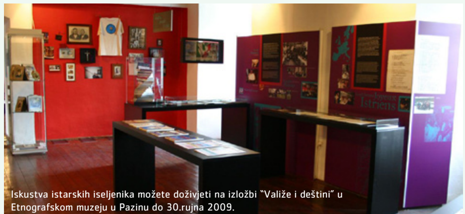
Iskustva istarskih iseljenika možete doživjeti na izložbi "Valiže i deštini" u Etnografskom muzeju u Pazinu do 30. rujna 2009.

Izložba u Etnografskom muzeju Istre u Pazinu otvorena je do 30.09.2009., a prate ju i zvučni zapisi s iseljeničkim pjesmama i razgovorima. Kako su mnoga iseljenička društva Istrana aktivna u virtualnom svijetu interneta, postavljen je i internet kiosk na kojemu se mogu pretraživati njihove stranice, stranice restorana čiji su vlasnici Istrani, te drugih organizacija i zanimljivosti koje Istrani nude u svijetu. Na taj se način može dobiti jasnija slika o Istri u najrazličitijim regijama svijeta.