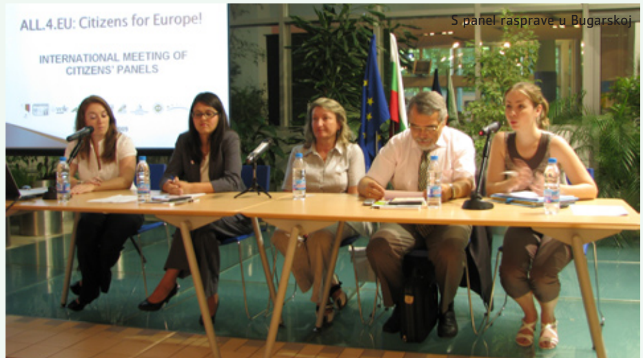
S panel rasprave u Bugarskoj

U sklopu projekta ALL.4.EU: Građani za Europu! koji Istarska županija provodi zajedno sa Zakladom za poticanje partnerstva i razvoja civilnog društva Istarske županije i drugim partnerima iz Europe, 7. i 8. srpnja u Sofiji održao