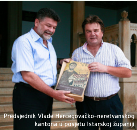
Predsjednik Vlade Hercegovačko-neretvanskog kantona u posjetu Istarskoj županiji