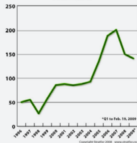
IMF ONE-YEAR FORWARD COMMITMENT CAPACITY (US$BILLIONS)

za svjetsko gospodarstvo po kojoj bi BDP eurozone u ovoj godini trebao pasti za 4,8 a u sljedećoj za 0,3 posto. Europska komisija prognozirala je u siječnju da će gospodarstvo eurozone u cijeloj 2009. zabilježiti pad aktivnosti za 1,9 posto dok bi u sljedećoj godini trebalo zabilježiti pozitivnu stopu rasta u visini 0,5 posto. (Hina)