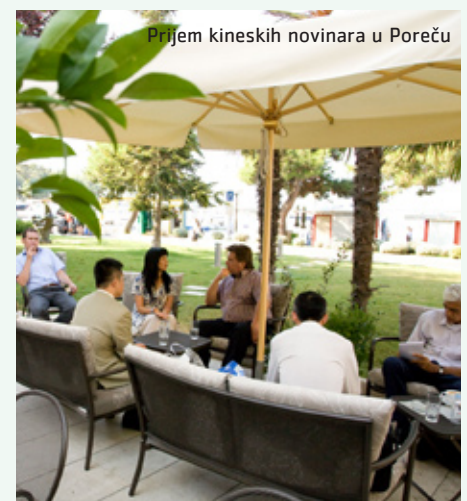
Prijem kineskih novinara u Poreču