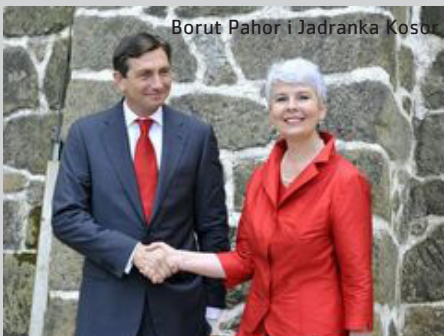
Borut Pahor i Jadranka Kosor

Premijeri Jadranka Kosor i Borut Pahor, nakon sastanka u Trakošćanu 31. srpnja, izjavili su da su Hrvatska i Slovenija dogovorile okvirni plan prema kojem bi se do kraja godine moglo pronaći rješenje graničnog spora i blokade hrvatskih pristupnih pregovora. Iako su se premijerka Jadranka Kosor i njezin kolega Borut Pahor dogovorili da nedavni razgovor u Trakošćanu ostane tajna, Slovenci su, čini se, progovorili.