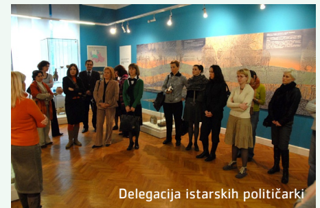
Delegacija istarskih političarki

Manifestacija "Dani Istre u Vojvodini" održavaju se bienalno a rezultat su zajedničkih interesa na polju kulture i gospodarstva te proeuropske politike. U ovogodišnjem posjetu predstavljanje su istarske žene koje su na vodećim mjestima u politici, gospodarstvu i kulturi. Promovirana su i prava žena kroz njihovo aktivno sudjelovanje u društvenom životu.