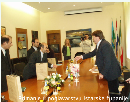
Primanje u poglavarstvu Istarske županije

Veleposlanik Islamske Republike Iran u Hrvatskoj, N.J.E. Mohammad Hassan Fadaifard posjetio je u 14. veljače 2008. godine, Istarsku županiju. Iranski veleposlanik, u čijoj je pratnji bio Abbas Norouzi, prvi savjetnik u veleposlanstvu, primio je istarski župan Ivan Jakovčić sa suradnicima.