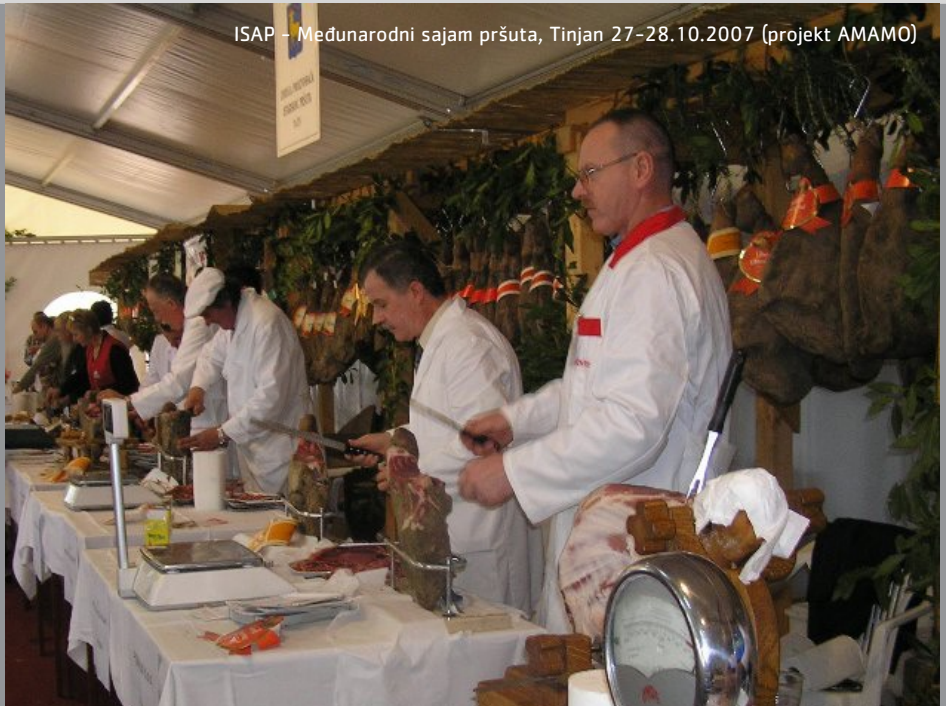
ISAP - Međunarodni sajam pršuta, Tinjan 27-28.10.2007 (projekt AMAMO)

Što se aktualnih "eurointegracijskih" vijesti tiče, velikih novosti nema. Novih poglavlja pregovora nema, pitanje ZERP-a još nije riješeno. Dobro je što je vanjskopolitički odbor europskog parlamenta "prepoznao" pitanje ZERP-a kao