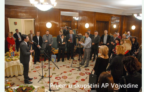
Prijem u skupštini AP Vojvodine

decentralizacija ali i to da obje regije imaju najveći razvojni potencijal u svojim državama. Danas, one dijele zajedničku težnju ka Europi i činjenicu da su sa svojim državama najsnažnije zakoračile prema europskim integracijama.