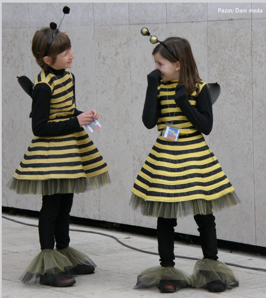
Pazin: Dani meda

Planira se i organiziranje Završne konferencije