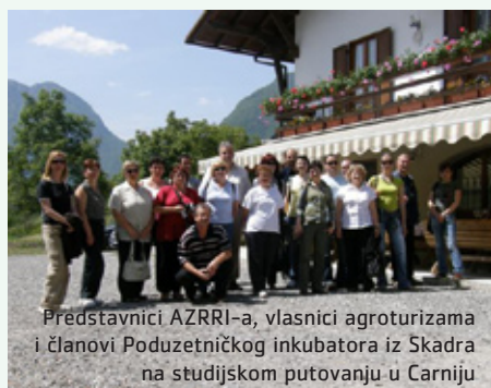
Predstavnici AZRRI-a, vlasnici agroturizama i članovi Poduzetničkog inkubatora iz Skadra na studijskom putovanju u Carniju

Ova regija nije odabrana slučajno, upravo je ona partner na projektu AMAMO koji ima za cilj valorizaciju izvornih vrijednosti teritorija u ruralnom području.