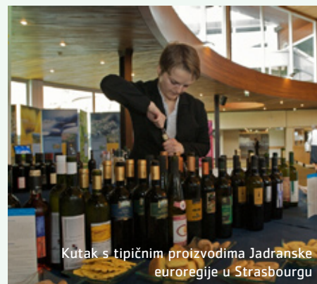
Kutak s tipičnim proizvodima Jadranske euroregije u Strasbourghu

Tijekom trodnevnog zasjedanja Jadranska euroregija je postavila i info pult gdje su zainteresirani mogli dobiti informacije i promo materijale.