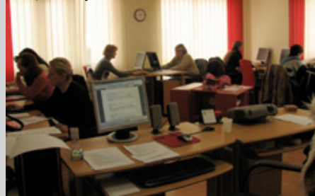
ECDL edukacija za žene iznad 40 godina starosti Pula, travanj 2008.

Provedba edukacija započela je 01. travnja i do sada je održano 11 edukacija u svim istarskim gradovima za ukupno 480 polaznika. U edukacije smo uključili i učenike završnih razreda istarskih srednjih škola na koje smo željeli djelovati informativno, budući da se uskoro susreću s tržištem rada i predstavljaju potencijalno uspješne buduće poduzetnike.