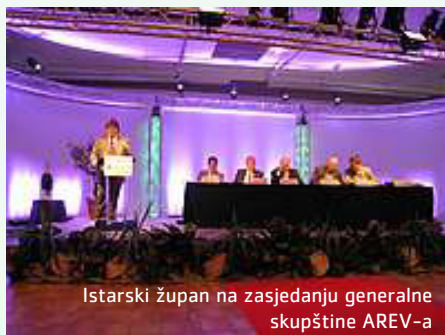
Istarski župan na zasjedanju generalne skupštine AREV-a

Istarska je županija prva hrvatska županija koja je postala članicom Asocijacije vinskih regija Europe (AREV).