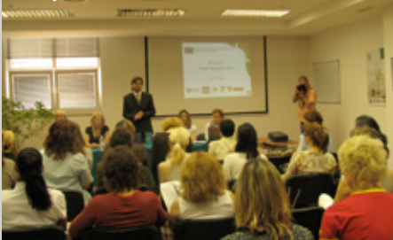
Dođela ECDL certifikata, konferencija za medije 26.05.2008.

Ciljne grupe projekta su dvije skupine koje čine više od polovice ukupnog broja nezaposlenih u Istri: mladi do 24 godine i žene preko 40 godina starosti. Predviđeno je da će ukupno 520 nezaposlenih osoba proći edukacije organizirane u projektu.