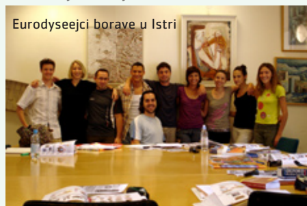
Eurodyseejci borave u Istri

Istarska županija kao članica Skupštine europskih regija već dvanaestu godinu aktivno sudjeluje u programu Eurodyssée – međunarodnom programu razmjene mladih, između regija članica SER-a. Mladi iz Europe kroz ovaj program u nekoj od 33 europske regije borave od 3 do 6 mjeseci te pritom stječu profesionalno iskustvo na različitim područjima i usavršavaju strani jezik.