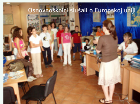
Osnovnoškolci slušali o Europskoj uniji