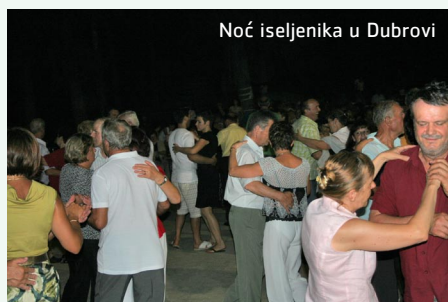
Noć iseljenika u Dubrovi