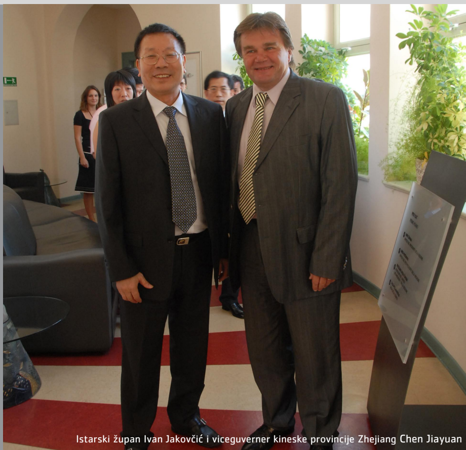
Istarski župan Ivan Jakovčić i viceguverner kineske provincije Zhejiang Chen Jiayuan

U ovom broju imamo i nekoliko "neeuropskih tema". Istarsku je županiju posjetila Visoka delegacija kineske provincije Zhejiang, jedne od najrazvijenijih u Kini, koja ima preko 40 milijuna stanovnika, a s kojom imamo potpisan Sporazum o suradnji. To je već četvrti posjet najviših dužnosnika provincijske vlade ili skupštine Zhejianga Istarskoj županiji. U uzvratnom ćemo posjetu, koji bi se mogao dogoditi sredinom 2009. podržati potencijalne gospodarske interese istarskih tvrtki na najdinamičnijem svjetskom tržištu. Stoga i pozivamo sve tvrtke koje imaju gospodarske planove u Kini da nam se jave. Svakako treba uzeti u obzir i razvoj suradnje u turizmu jer rastući životni standard omogućava putovanja sve većem broju kineskih građana. U Labinu je održana Noć istarskih iseljenika. Na margini manifestacije održali smo radni sastanak s predstavnicima uglavnom newyorških iseljenika gdje je aktualizirana potreba za podrškom županije u rješavanju imovinskih, pravnih ili administrativnih pitanja. U tom smislu dogovoreno