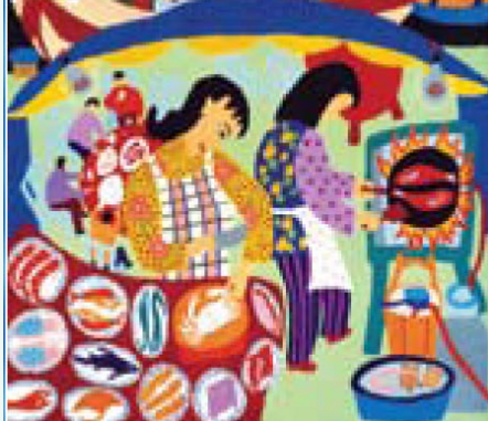
Jedna od izloženih slika pod nazivom "Noćni obrok na ulici"

-Zahvaljujem se kineskim prijateljima što žele suradnju s našom malom regijom i drago mi je da danas imamo priliku vidjeti konkretnu kulturnu suradnju- rekao je župan Jakovčić.