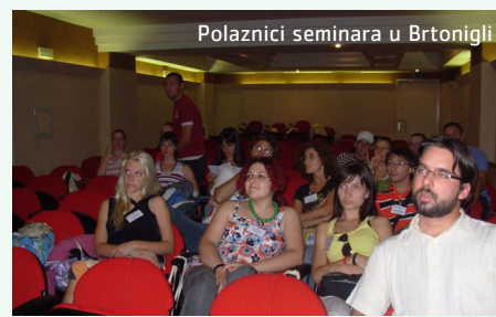
Polaznici seminara u Brtoniglu

Srbije i Albanije, tijekom seminara odradili su radionice fokusirajući se na treninge i na razvijanje mreža i partnerstva te su lokalnoj mladeži predstavili svoje projekte i politike za mlade koje njihove lokalne vlasti vode, s zajedničkim ciljem predlaganja novih načina aktivnog sudjelovanja mladih u svojim zajednicama.