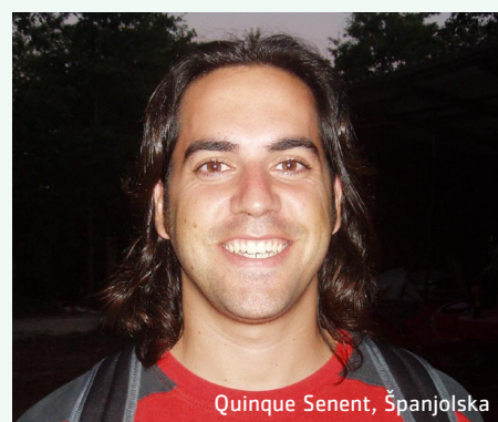
Quinque Senent, Španjolska

"Veoma je težak ali učim ga malo, pomalo"