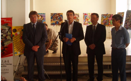
Otvorenje izložbe Slikarstva ribara provincije Zhejiang u MMC-u Luka